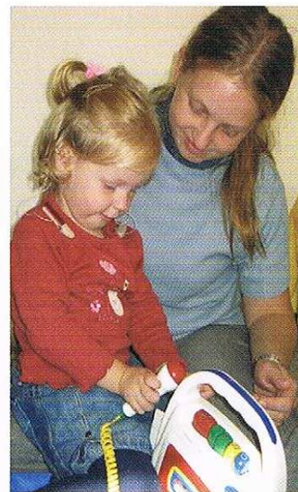
Mutter und Tochter hören ein selbst gesungenes Lied an

Familien mit einem hörbeeinträchtigten oder gehörlosen Kind sind mit vielen unterschiedlichen Anforderungen im Alltag konfrontiert. Daraus können sich im Einzelfall, abhängig von den vorhandenen Netzwerken und persönlichen Ressourcen, schwierige – manchmal sogar unlösbar erscheinende – Situationen ergeben. Eltern, die von den Fachkräften auf diese Situationen vorbereitet und unterstützend begleitet werden, gehen gestärkt aus Krisen hervor. Fachkräfte, die sich gegenseitig unterstützen, können Eltern immer besser begleiten und lernen miteinander und voneinander. Gemeinsam können wir so „unsere“ hörbeeinträchtigten Kinder stärken.