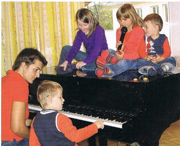
Konzentrierte Musiktherapie am und auf dem Klavier

Fortsetzung von Seite 24 verschmelzen. Die Kinder wollen es immer wieder hören und erleben, und üben so ganz nebenbei das aufmerksame Zuhören als unabdingbare Vorläuferfertigkeit, um die aktive Sprache zu erwerben.